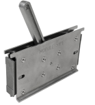
Outils de maintien Roxtec